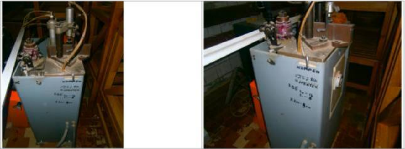
Фото-таблиця № 4 до звіту з незалежної оцінки майна № Пр 6/1. Верстат кромочний "H01.2HEK", фірма-виробник — "HOLZHER", type1411, serial№ 67210-012.