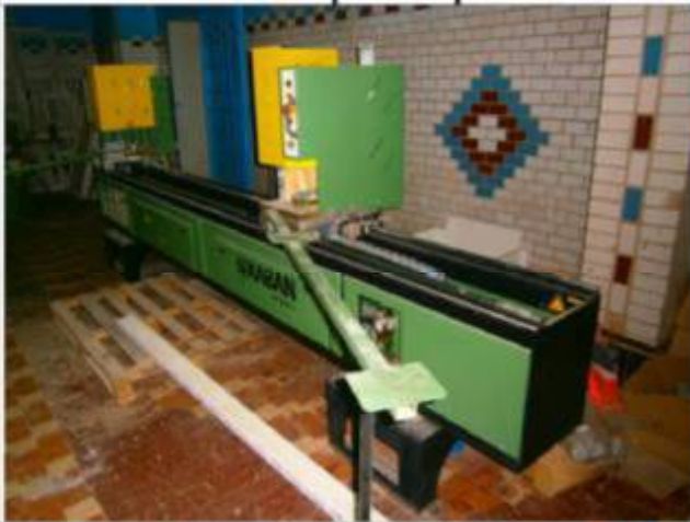
Фото-таблиця № 1 до звіту з незалежної оцінки майна № Пр 6/1. Верстат зварювальний ВВ 2020-1, serial№ 1524, 4 kW, 220 V.